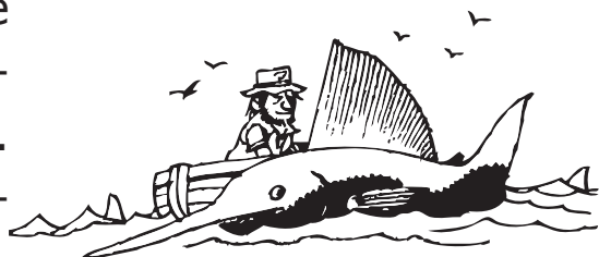
Старецот, морето и многу големата риба

И мразам да го споменувам ова, но штотуку го забележав мојот распоред за домашни задачи. Тој е закачен на мојата табла. За само неколку дена имам должност да направам рецензија на книга за часовите по англиски јазик кај госпоѓа Блумберг. А јас сум решена да го зацврстам добриот впечаток што го имам кај неа - нејзе всушност ѝ се допадна мојот последен есеј. Веќе ја прочитав книгата. Ја избрав Старецот и морето . Сега, сè