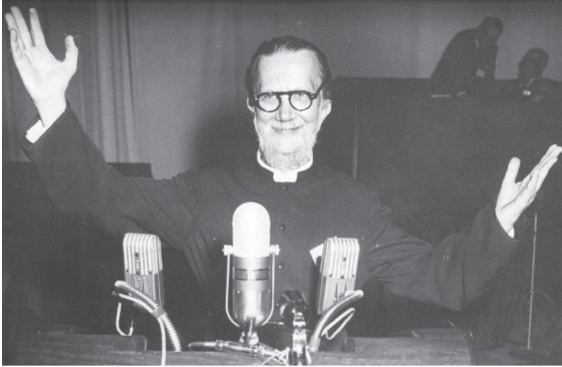
Евансїон, авїусї, 1954.