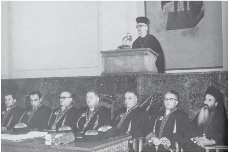
Солун, новембар, 1959. г.